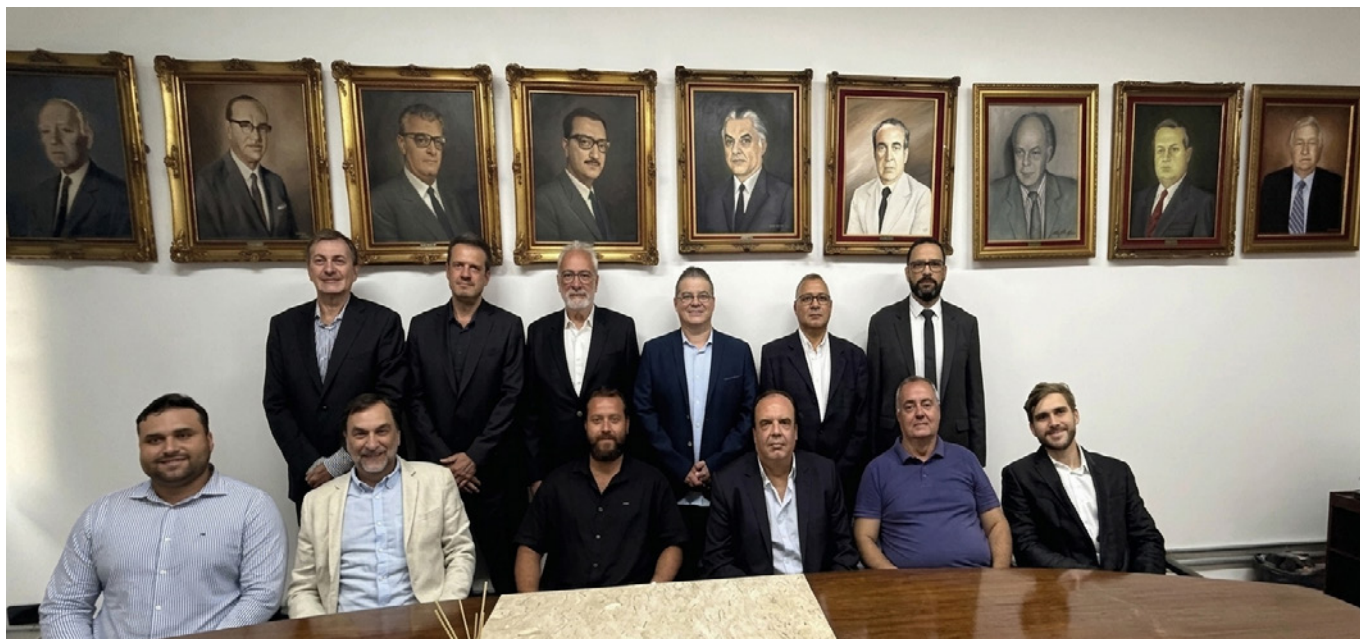
Foto: diretores presentes na posse com a galeria das diretorias desde 1936.

Durante a solenidade, a diretoria foi empossada e recebeu o diploma que simboliza o início de sua gestão.